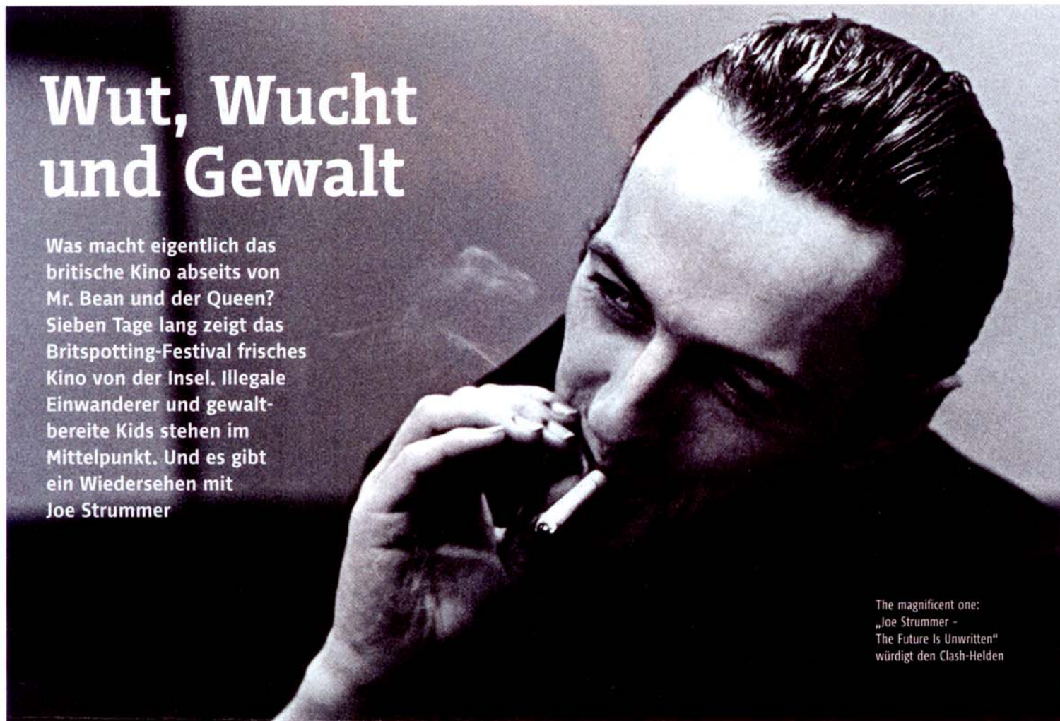
The magnificent one: „Joe Strummer - The Future Is Unwritten“ würdigt den Clash-Helden

Was macht eigentlich das britische Kino abseits von Mr. Bean und der Queen? Sieben Tage lang zeigt das Britspotting-Festival frisches Kino von der Insel. Illegale Einwanderer und gewaltbereite Kids stehen im Mittelpunkt. Und es gibt ein Wiedersehen mit Joe Strummer